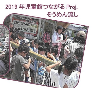
2019年児童館つながるProj. そうめん流し